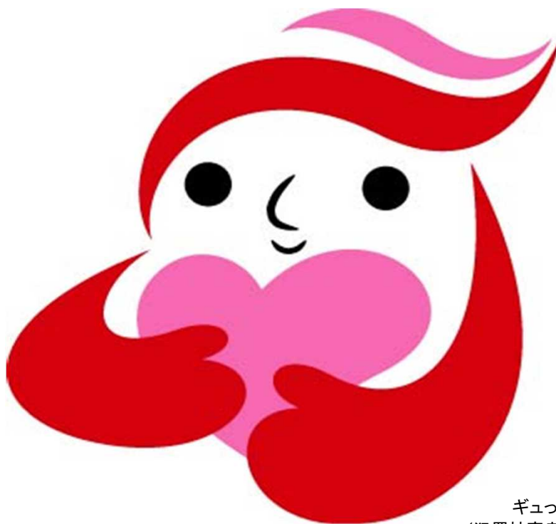
ギョっちゃん (犯罪被害者等支援シンボルマーク)

ある日、突然、犯罪の被害にあってしまった…… 苦しい……つらい……誰かに話を聞いてもらいたい…… これからどうやって生活したらいいの？