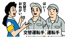
交替運転者の配置