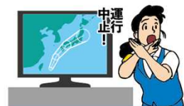
異常気象時等の措置