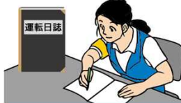
運転日誌の備付け