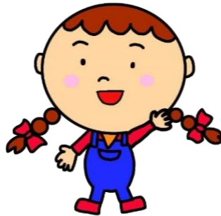
大阪府警察本部交通部 交通安全キャラクター なっちゃん