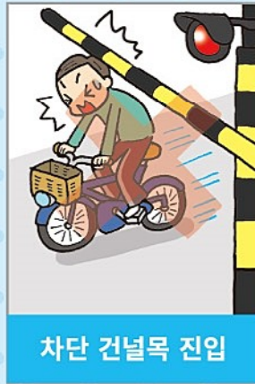
차단 건널목 진입