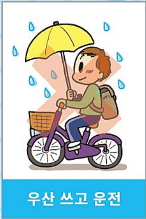
우산 쓰고 운전