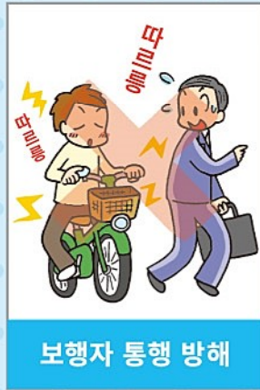
보행자 통행 방해