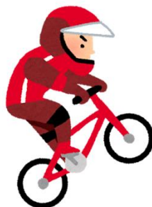
自動車制動装置不良（ブレーキ無し）