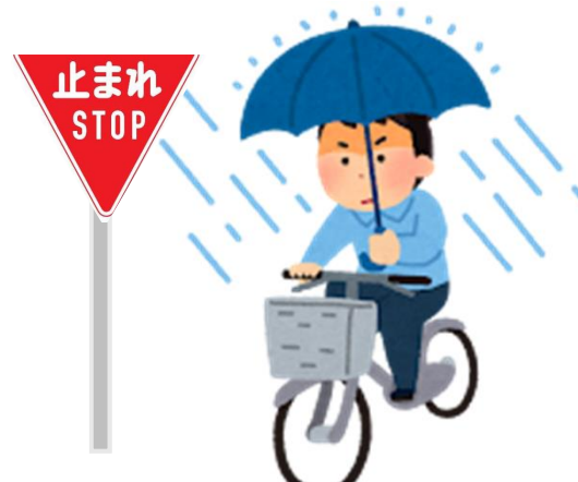
傘を差しながら一時不停止