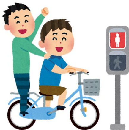
2人乗りしながら赤信号無視