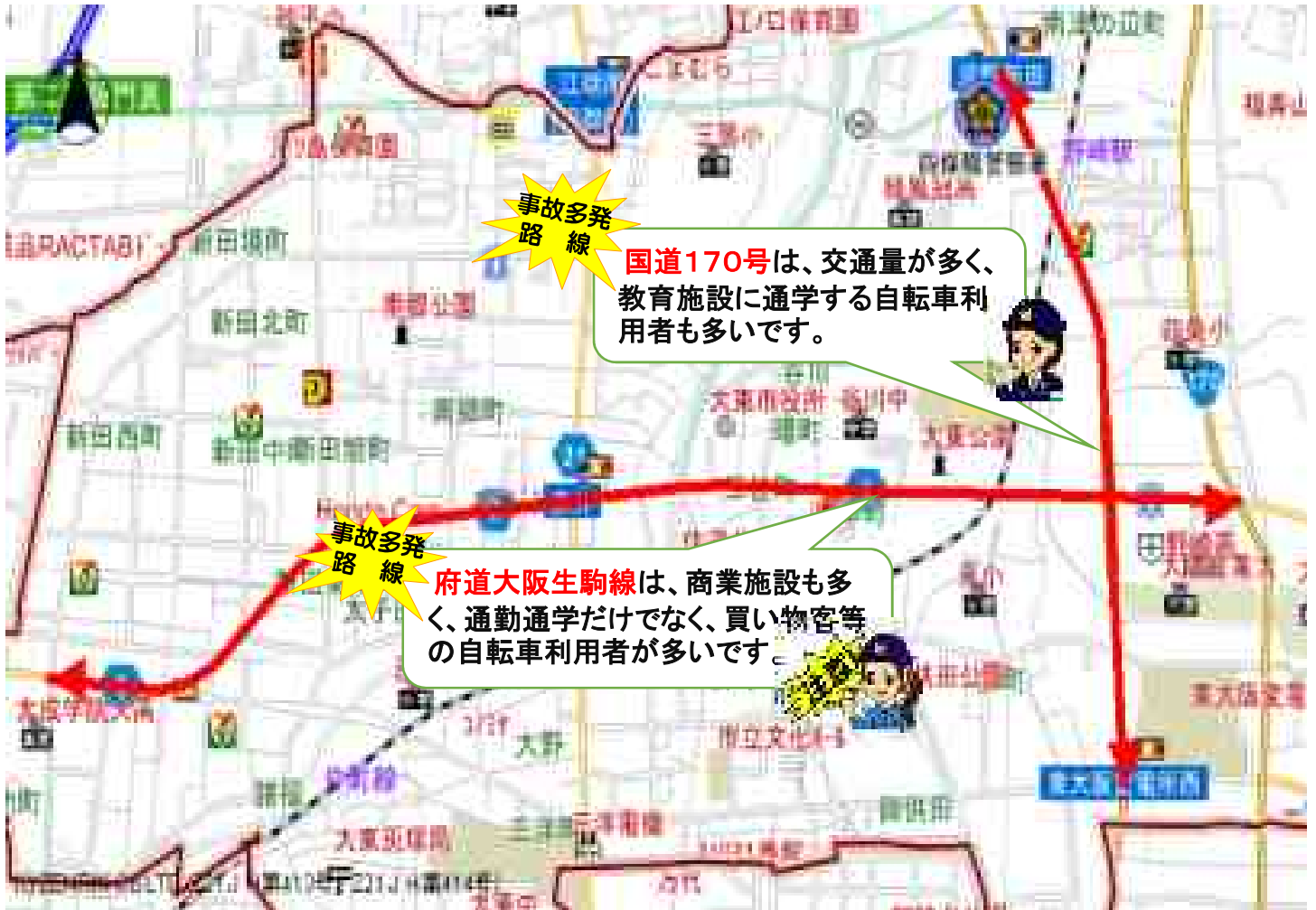
道路形状別自転車関連事故発生状況(R3~R5)