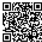
可搬式オービス広報啓発動画QRコード