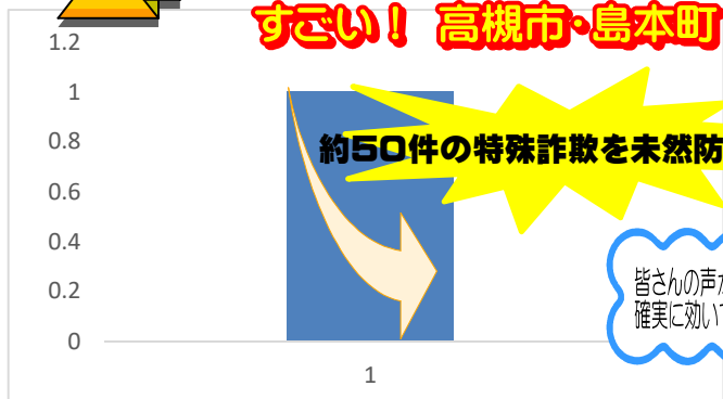
令和6年3月11日までの高槻署管内における特殊詐欺発生状況